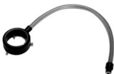
Fibre annulaire 5/8"