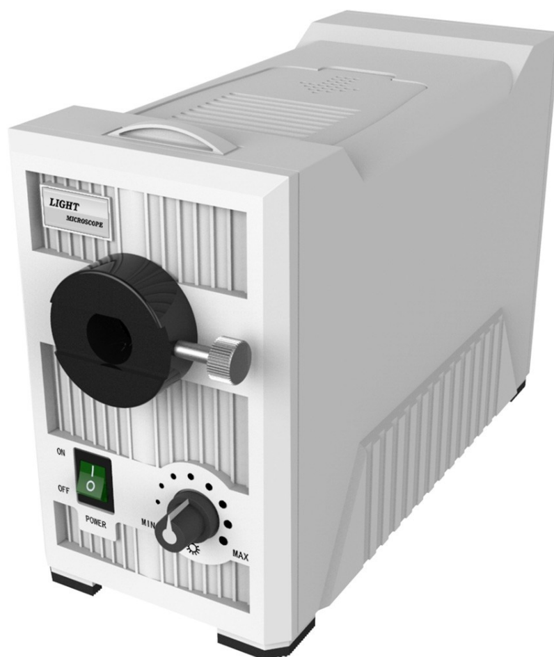
LED 15 Watts