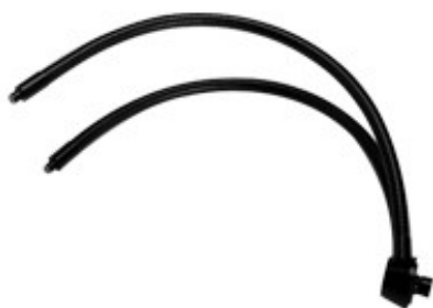
Fibres doubles 5/8 "