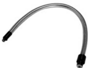
Fibre simple 5/8"